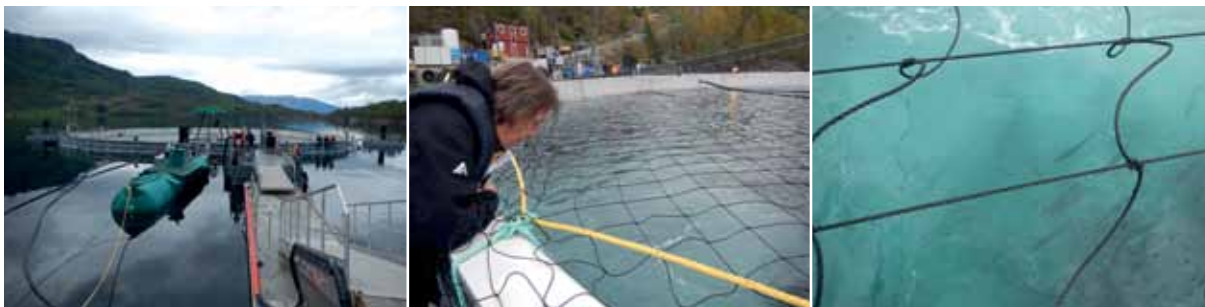
Semisluten odling i Norge.