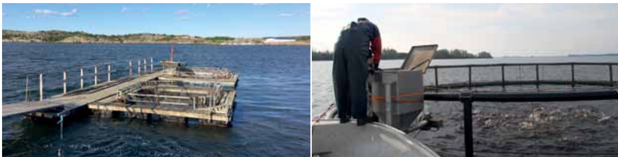
Odling av regnbåge i kassar i Fjärholm, Bohus-Björkö i Bohuslän och Tiraholm, Småland.