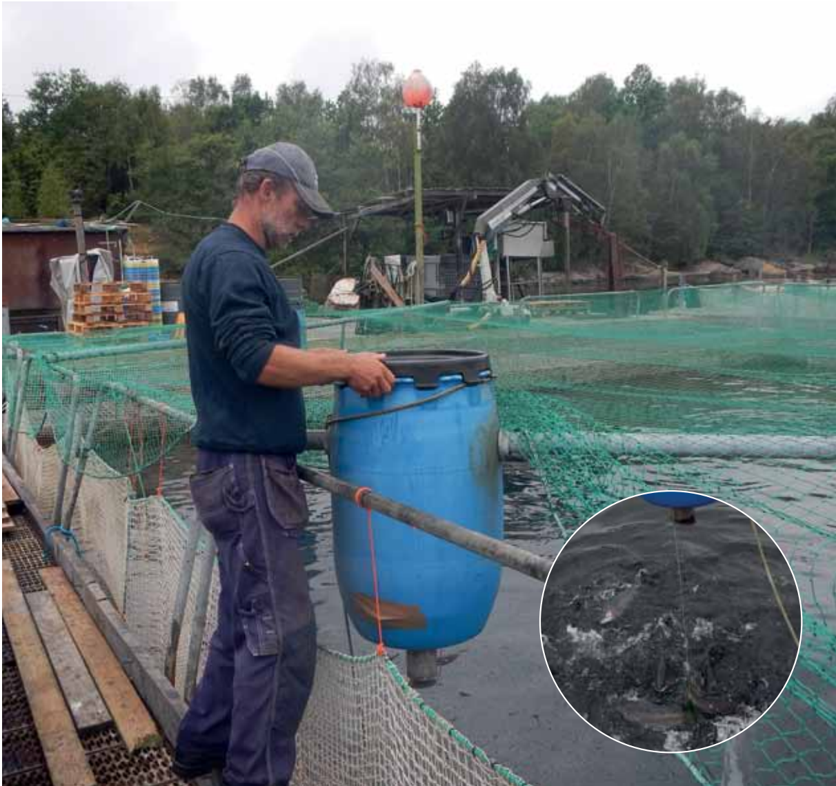
Matdax för regnbåge vid Tjärö Lax, Blekinge.